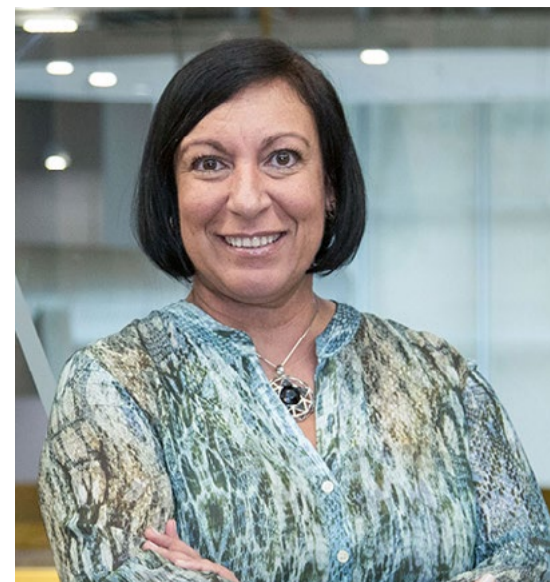
Garré: A troca de informações ganha centralidade em contextos de crise

como o da pandemia de Covid-19, que força muitas marcas a refletir sobre que tipo de comunicação devem ter e como devem agir. O cuidado deve ser tomado no sentido de evitar mensagens que possam ser mal interpretadas ou conteúdos que possam gerar desserviços.