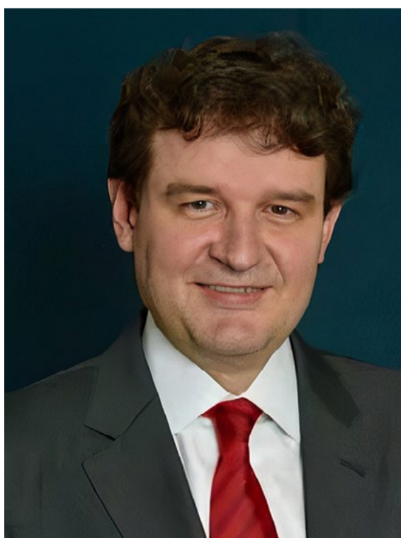
Ambiel: “As organizações podem colocar os empregados em banco de horas, tendo 18 meses para compensar esse período”