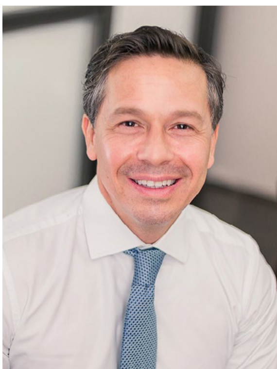
Natal: “Há necessidade de conceder mais alívio, de forma abrangente, para a recuperação em médio e longo prazos”

A primeira possibilita que as empresas flexibilizem a concessão de férias, podendo antecipá-las até mesmo nos casos dos trabalhadores que ainda não têm o direito adquirido. “Outro mecanismo dessa MP é que